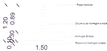
PLINTO DE CIMENTACIÓN